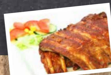
SPARERIBS € 8,25