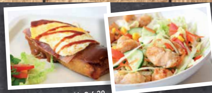
LOEMPIA SPECIAAL € 4,30