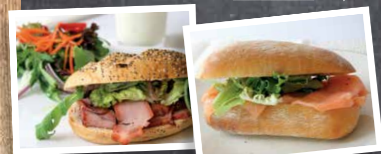
GEGRILD VARKENSVLEES € 4,45