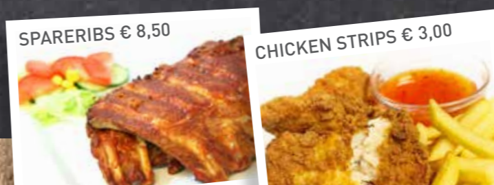
SPARERIBS € 8,50